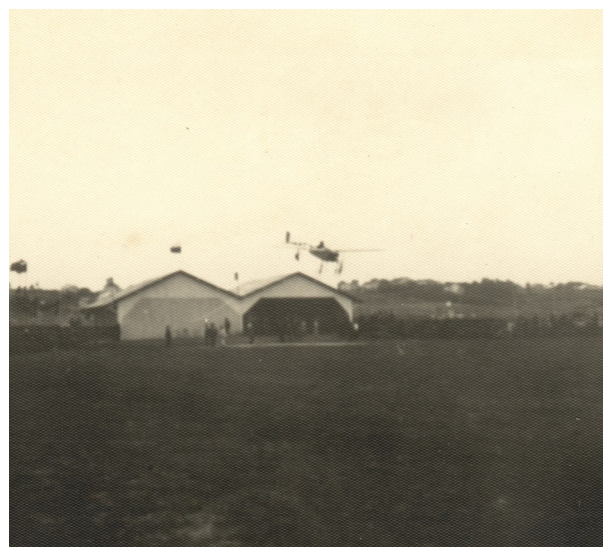
Aterrizaje en el aeródromo de La Albericia 747