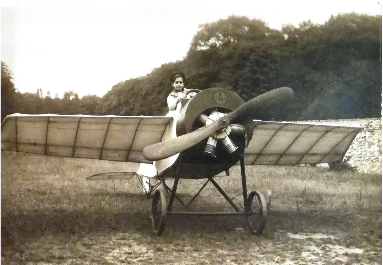
Un niño subido sobre un monoplano "pingüino" 748