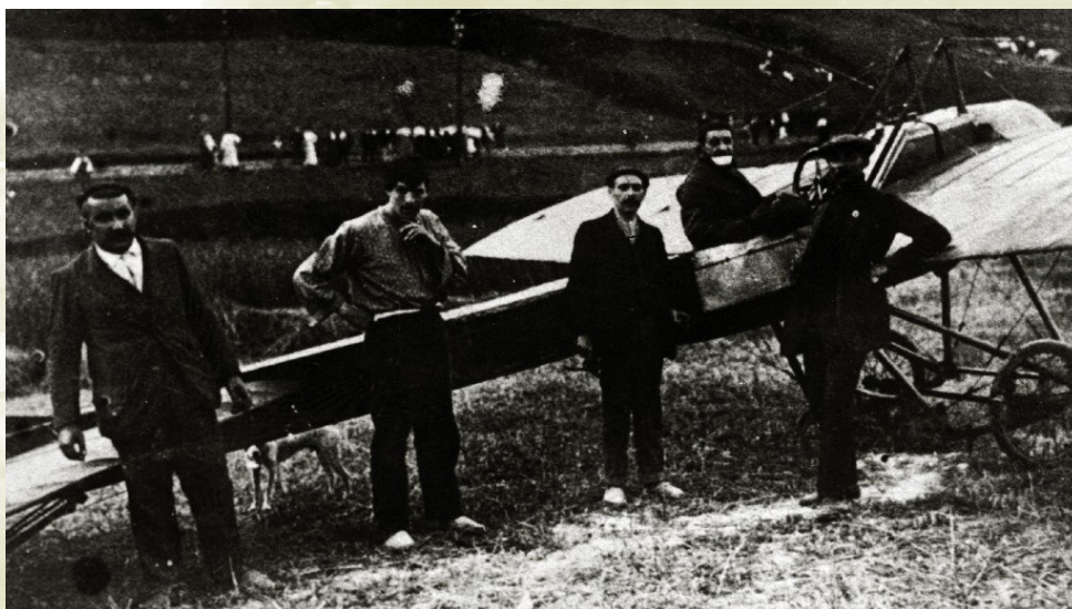
El aviador francés Terce en Eibar.