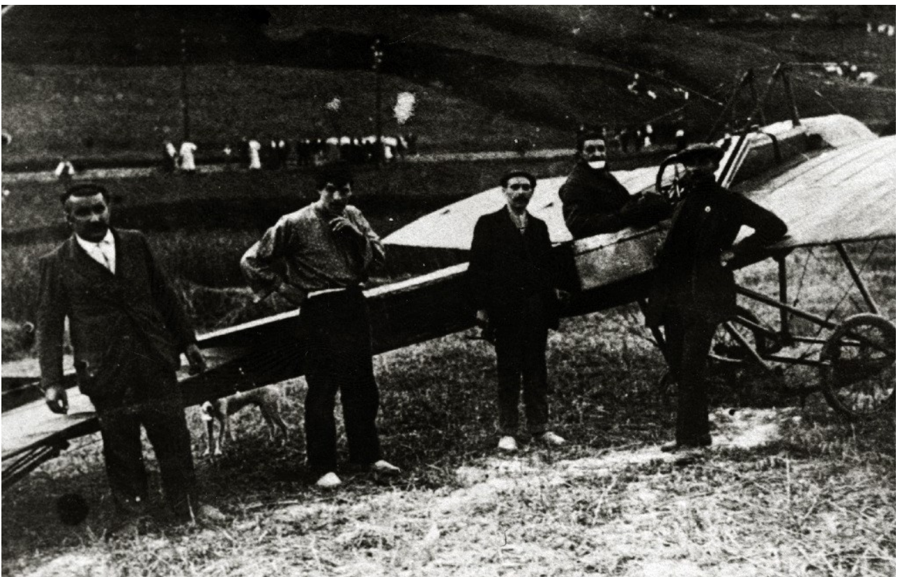
El aviador Terce en Eibar 746