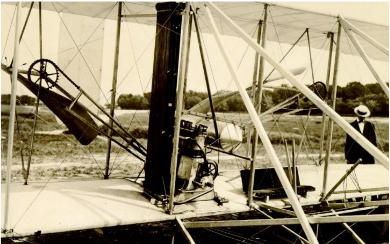
Detalle de un aeroplano Wright 749